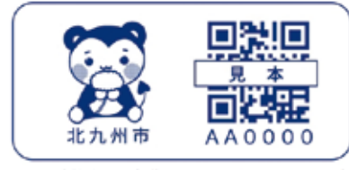
シール見本(実際のサイズは約5センチメートル×2.5センチメートル)

認知症などで行方不明になった際、衣服等に貼った二次元コードが読み取られると、保護者(ご家族)へ瞬時に発見通知メールが届きます。 発見者は二次元コードを読み取ると、ニックネームや注意すべきことなど対応方法が分かります。