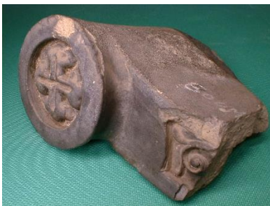
浦上天主堂の軒瓦 (長崎原爆資料館所蔵)