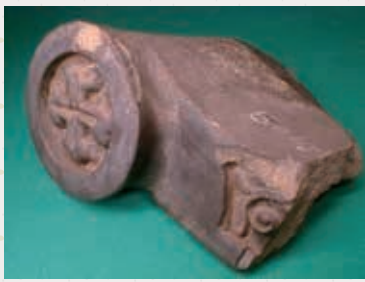
浦上天主堂の軒瓦 (長崎原爆資料館所蔵)