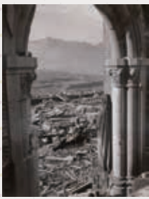
浦上天主堂南翼廊入口内部から山里町方面を望む

本企画展では、長崎原爆資料館から原爆被災資料やパネルをお借りし、長崎原爆の実相を展示します。また、長崎原爆に関する当館収蔵資料や文書館所蔵資料より、北九州において長崎原爆がどのように語られてきたのかを明らかにします。