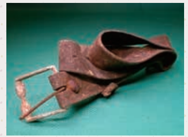
皮ベルト (長崎原爆資料館所蔵)