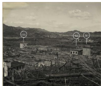
グビロが丘から見た長崎医科大学