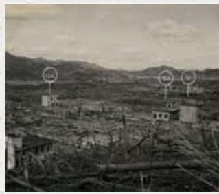
グビロが丘から見た長崎医科大学