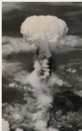
きのこ雲

9月3日(火)～9月29日(日) 折尾まちづくり記念館 オープンスペース (八幡西区堀川町5番23号)