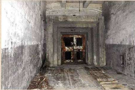
平和のまちミュージアム