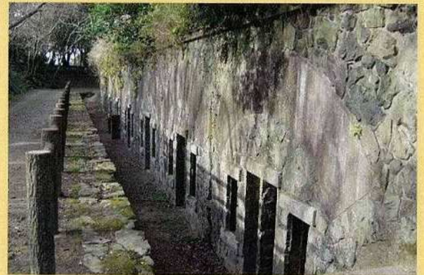
北方自衛隊駐屯地内史料館