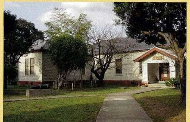
平和のまちミュージアム