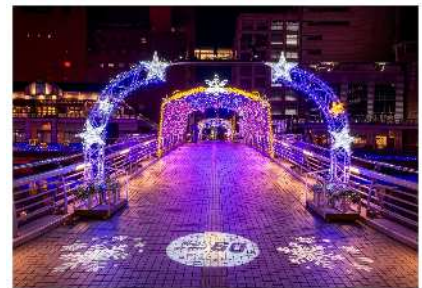
小倉イルミネーション2023

LEDイルミネーションを導入し、街なかのにぎわい創出を図りつつ環境にもやさしい事業の展開を図ります。