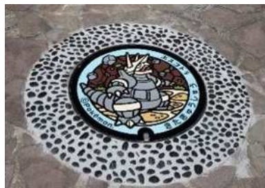
リバーウォーク北九州 (ボスゴドラ)