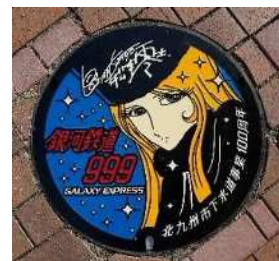
デザインマンホール

小倉駅周辺に9箇所、北九州空港に1箇所の計10箇所設置していますので、ぜひ探してみてください。