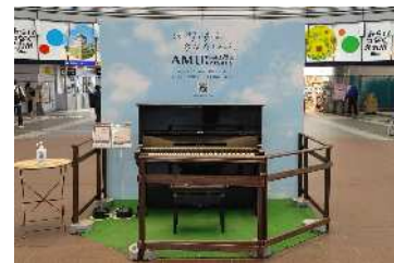
ストリートピアノ

JRウォーキングやJAM広場でのイベント開催など、小倉都心部の集客を促進し、小倉駅周辺の文化施設や商店街との回遊性を高めます。