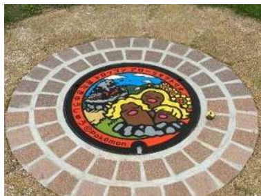
あさの汐風公園 (アローラダグトリオ・トロゴン)

1枚1枚がオリジナルデザインで、小倉北区には、あさの汐風公園に1枚、リバーウォーク北九州に1枚を設置していますので、ぜひ探してみてください。