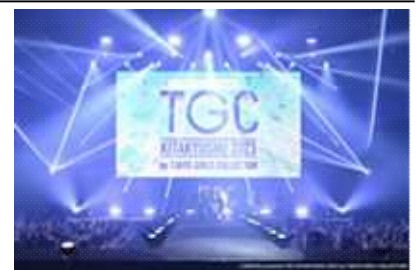
CREATEs presents TGC KITAKYUSHU 2023 by TOKYO GIRLS COLLECTION

人気モデルによるファッションショーやアーティストライブのほか、公募キッズモデルによるステージが実施され大いに盛り上がりました。