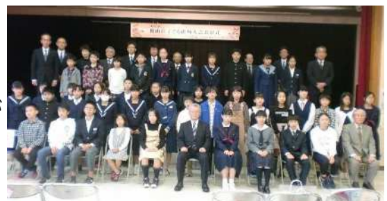
櫓山荘子ども俳句大会表彰式

久女をはじめ、先人たちの業績を顕彰し、子どもたちの情操や表現力を高めるため、毎年「櫓山荘子ども俳句大会」を開催しています。