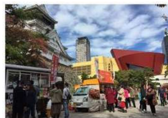
Canal Viola(カナル ヴィオラ)

この取組は、民間団体による公共空間を活用したまちのにぎわいづくりとして、約1年間の社会実験を経て、平成28年11月から本格実施されています。