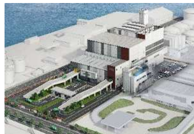
新日明工場 完成予想図

平成3年に稼働開始した日明工場の老朽化が進行しているため、市内ごみの安定処理を継続すること等を目的として、現工場敷地内に新日明工場を建設します。新工場では高効率ごみ発電等によるエネルギー回収の徹底や、最先端の省エネ機器・技術等を導入することにより脱炭素化を図ります。（令和6年度竣工予定）