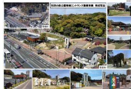
到津の森公園 完成写真

また、到津の森公園の賑わいづくりや魅力向上を図るため、Park-PFI 制度を活用して、令和5年3月に南側エントランスのリニューアル整備を行いました。キリンエレベーターやアニマルモニュメントのほか、授乳室やキッズトイレを備えた森の案内所や飲食施設などを整備しました。また、この整備に合わせて、動物をモチーフにデザインした特別なバス停も設置しました。