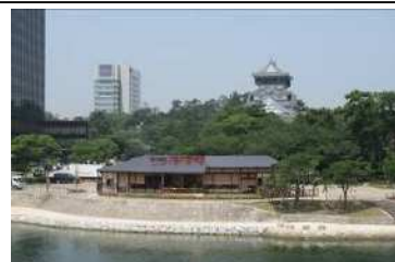
珈琲所コマダ珈琲店（北九州勝山公園店）

この取組は、都市公園法の「公募設置管理制度（Park-PFI）」を全国で初めて活用したもので、公園内に民設民営のカフェを導入し、まちのにぎわいを創出しています。