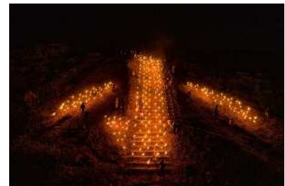
小倉の「小」の文字が浮かび上がる様子

1948年に福岡国体の選手を歓迎するために始まった小文字焼。いまでもお盆の迎え火として毎年8月13日、地元の消防団が中心となり実施しています。小文字山の山頂で松明300本を「小倉（こくら）」の「小（しょう）」の字に並べ、点灯します。