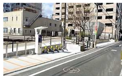
堺町地区の駐輪施設

環境負荷の少ない自転車の利用を促進するため、安全で快適な自転車通行空間の整備や、駐輪施設の整備などに取り組み、脱炭素型のまちづくりを推進します。