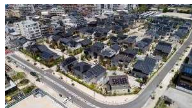
ゼロ・カーボン仕様のスマートハウス群

また、まちの魅力向上を目的に、住民・事業者が全員参加してまちの管理・運営を担う「タウンマネジメント」の仕組みを導入しています。