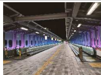
小倉駅周辺のライトアップの様子

小倉駅周辺の夜間景観や明るさの向上を目的に、令和元年度からライトアップに取り組んでいます。季節やイベントに合わせた様々な色でまちを演出し、まちの賑わいの創出や回遊性の向上に繋げています。