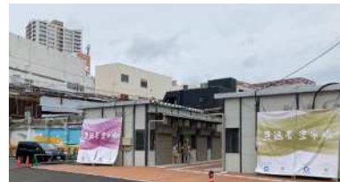
仮設店舗「旦過青空市場」