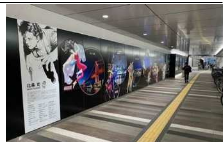
東側通路 フォトスポット

東側通路は全面改修工事を行い、都心部等の魅力情報を発信する「展示スペース」の設置や、壁面には、撮って楽しむフォトスポットを整備しています。西側通路も照明、天井や壁を明るい色調に改修し、明るく快適な空間を提供しています。