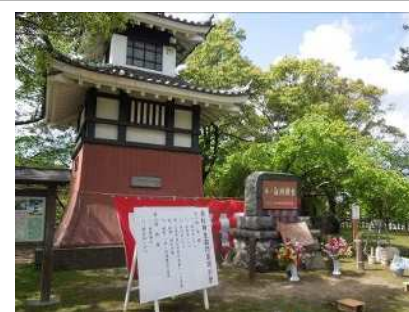
岩松助左衛門翁顕彰祭