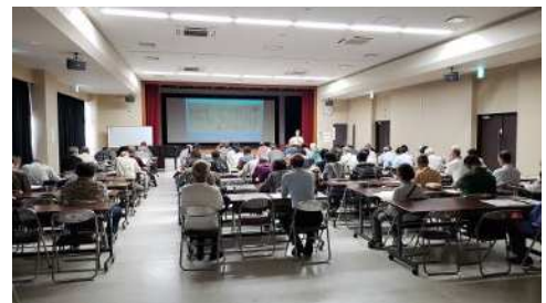
小倉のおもしろ歴史文化塾

長崎街道や城下町小倉の歴史と文化を学び、次世代に伝えることを目的として平成8年に発会した「長崎街道小倉城下町の会」は、五街道沿いの歴史・文化を探訪する「史跡探訪ウォーク」や「小倉のおもしろ歴史文化塾」などの様々な活動を精力的に行っています。