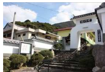
圓通寺と史跡説明板

九州各地にのびていた五街道（長崎街道、中津街道、秋月街道、唐津街道、門司往還）の起点であった常盤橋。その道筋や区内に点在する史跡等を紹介することで、小倉の歴史資産を活かしたまちづくりを進めます。特に、歴史的・文化的にその由来や概要を説明すべき価値のある小倉北区内の史跡等につき、平成8年度から小倉北区独自で史跡説明板を設置しています。（令和6年4月末現在：37箇所）