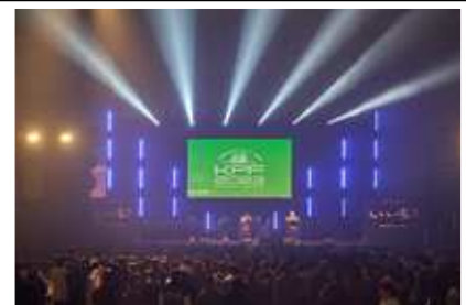
北九州ポップカルチャーフェスティバル2023

漫画やアニメといった若い世代に人気の高いポップカルチャーを切り口に、地元と連携した企画などで本市の魅力を発信し、小倉都心部のにぎわい創出を目指します。