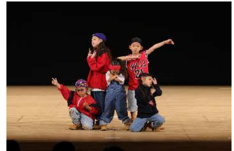
北九州市長杯 ストリートダンスコンテスト2023