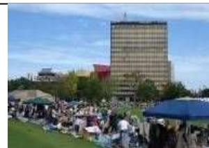
こくら de フリマ

都心部の楽しさや回遊性の向上、にぎわいの創出、環境保護のためのリユース・リサイクルの推進などを目的として、勝山公園大芝生広場等、小倉都心部において、フリーマーケットを開催しています。