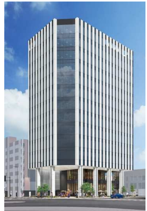
「BIZIA 小倉」外観イメージ

コクラ・クロサキリビテーションのリーディングプロジェクトとして、魚町三丁目5番地区において、（株）ミクニによる次世代仕様のオフィスビル「BIZIA 小倉」が建設中であり、令和6年6月に竣工予定となっています。