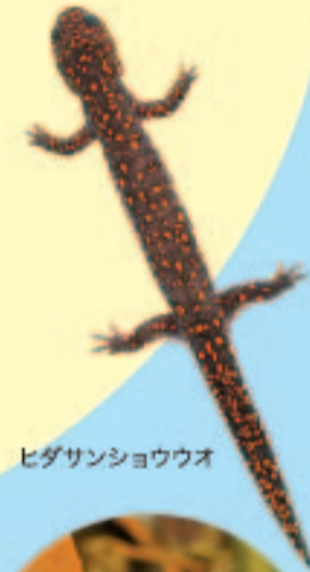
ヒダサンショウウオ