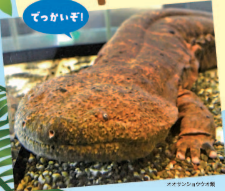
オオサンショウウオ類