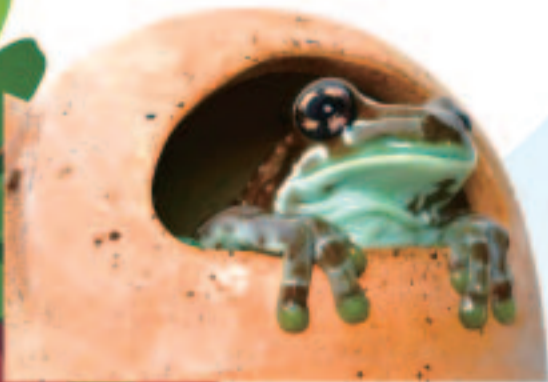
ミルクーフロッグ

★日本でもペットとしてなじみのある 種類の両生類・は虫類を中心に、 多数の生体を展示!