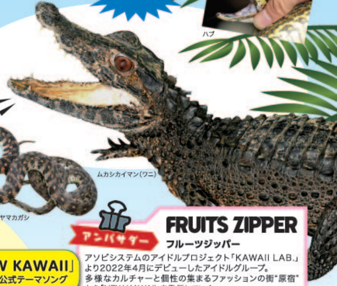
ムカシカイマン(ワニ)