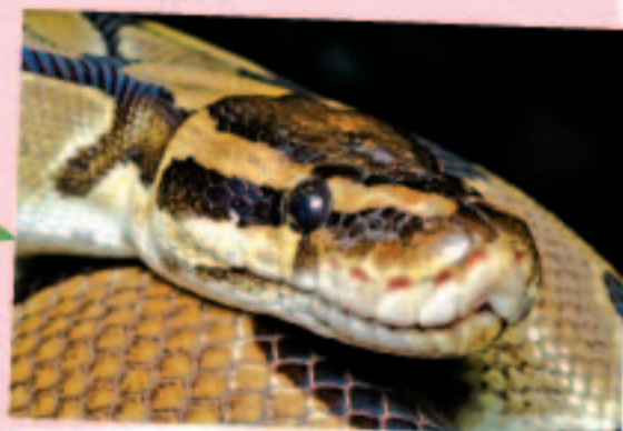
ボールニシキヘビ