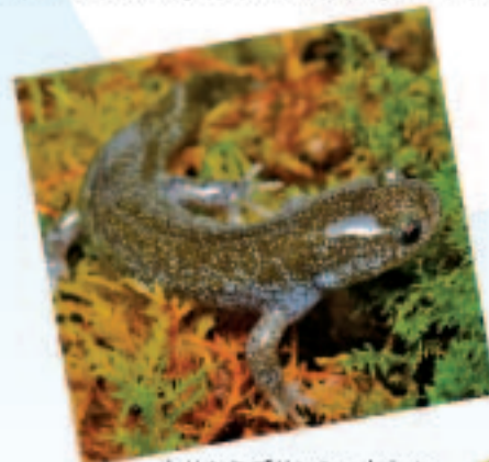
トサシミスサンショウウオ