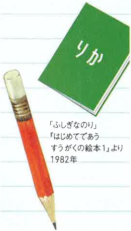
「ふしぎなりのり」 「はじめてであう すうがくの絵本1」より 1982年