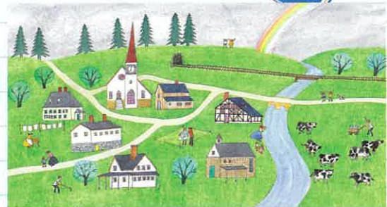
「7」「かぞえてみよう」より 1975年

本展では、創作の出発点である教員時代に着目し、学校の授業科目に見立てた構成により、多彩なジャンルの作品を紹介します。ユーモアとふしぎにあふれた安野光雅の世界をお楽しみください。