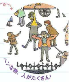
「7」な祭、人がたくさん!