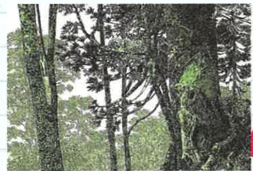
「もりのえほん」より 1977年