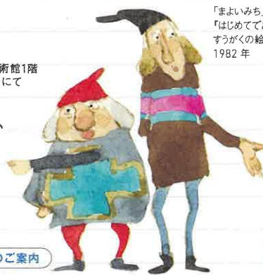
「まよいみち」 「はじめてであう すうがくの絵本 3」より 1982年