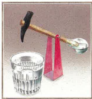
「水飲み鳥」 「空想工房の絵本」より 2014年