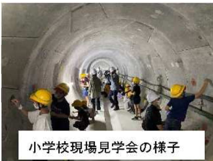
小学校現場見学会の様子