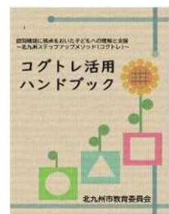
<コグトレ活用ハンドブック>