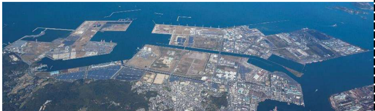
調査を行う北九州市響灘臨海エリア

このため、再生可能エネルギー由来等の国内製造と海外からの輸入のベストミックスによる水素等供給と、将来の拡張余地を十分に持った拠点整備が期待できます。