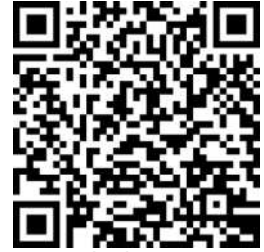
電子申請フォーム QRコード