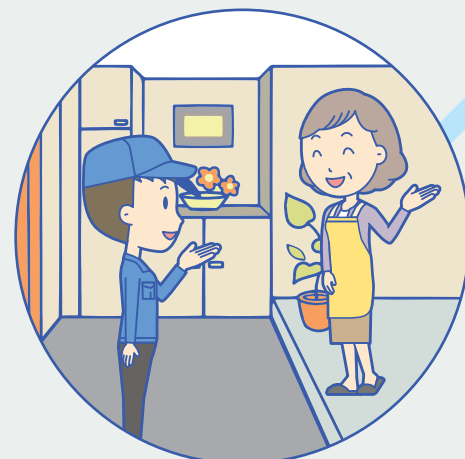
例 訪問時の声掛け

日常の活動の中で 熱中症になりやすい方への見守りや 声掛けの協力をしてくださる方