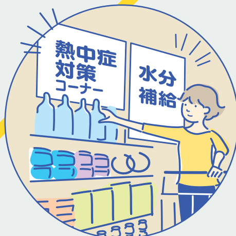
例 店舗でのPOP 掲示