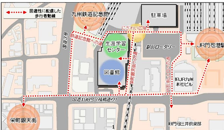
複合公共施設整備予定箇所