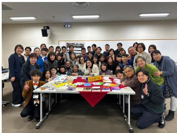
第8期のメンバーとお世話になったスタッフの皆様

誰にとっても居心地のいい認知症カフェが増えるように、この度の学びを活かしたいと思います。