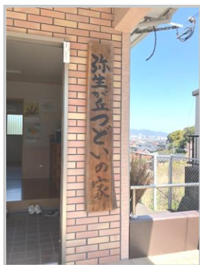
弥生が丘つどいの家で開催