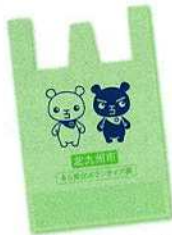
まち美化ボランティア袋