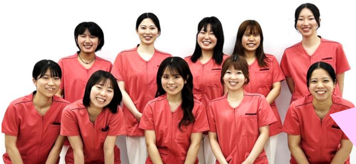
九州女子大学の学生のみなさん

管理栄養士を目指す私たちが、何度も試作してやっ と出来上がった「なでしこハヤシライス」です。今回、 北九州市で初めての試みとして実際に給食に提供す ることができ、とてもやりがいを感じています。 トマトが苦手な人にも食べやすい味になっています。 ぜひ、食べてみてくださいね。