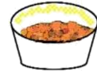
ごはんにかけます

大学コラボ献立は、市内栄養士養成大学と コラボレーションした、大学監修の献立です。 栄養士の卵である学生のみなさんから新し い発想を取り入れ、献立に生かしています。 今月は、八幡西区にある九州女子大学 栄養学科の学生が考案した、「なでしこハヤシ ライス」が登場します。