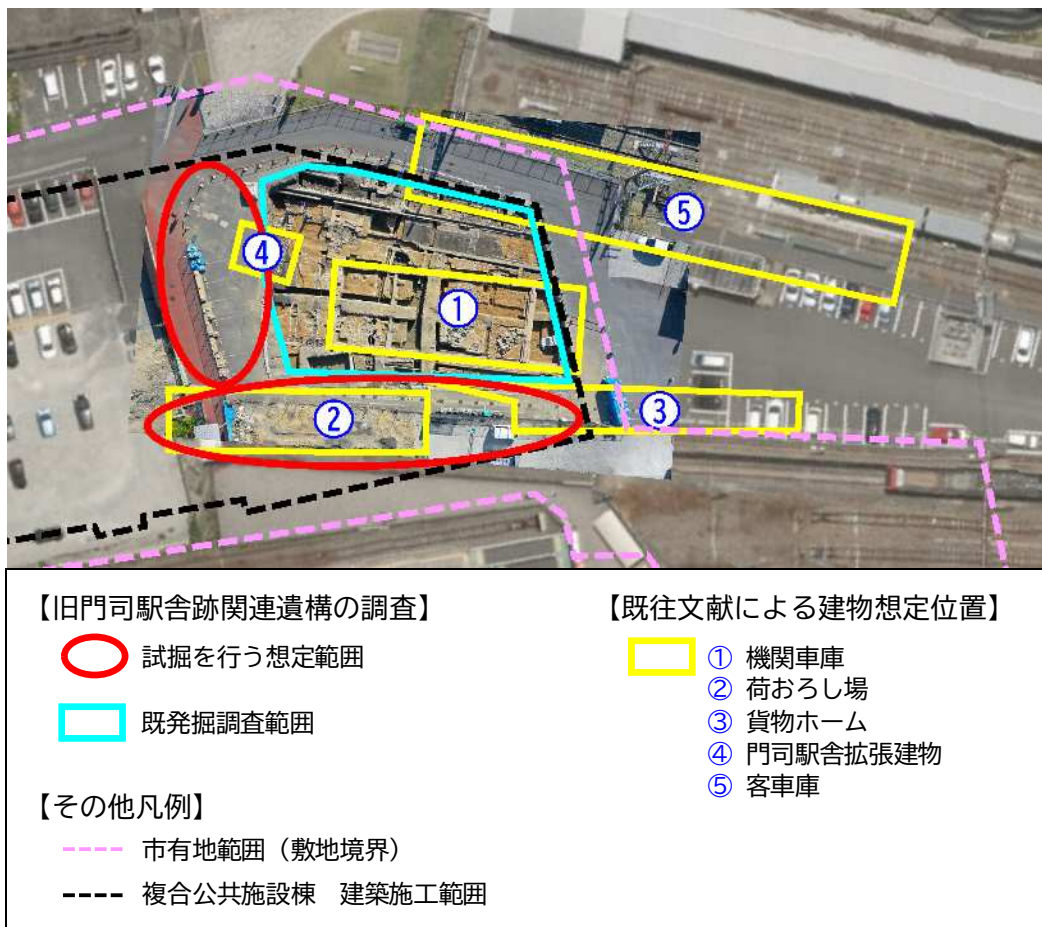
(図) 旧門司駅舎跡関連遺構の追加調査範囲の考え方