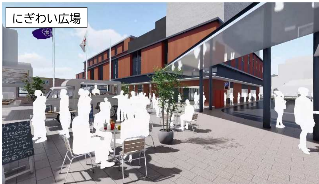
(図) 完成イメージパース