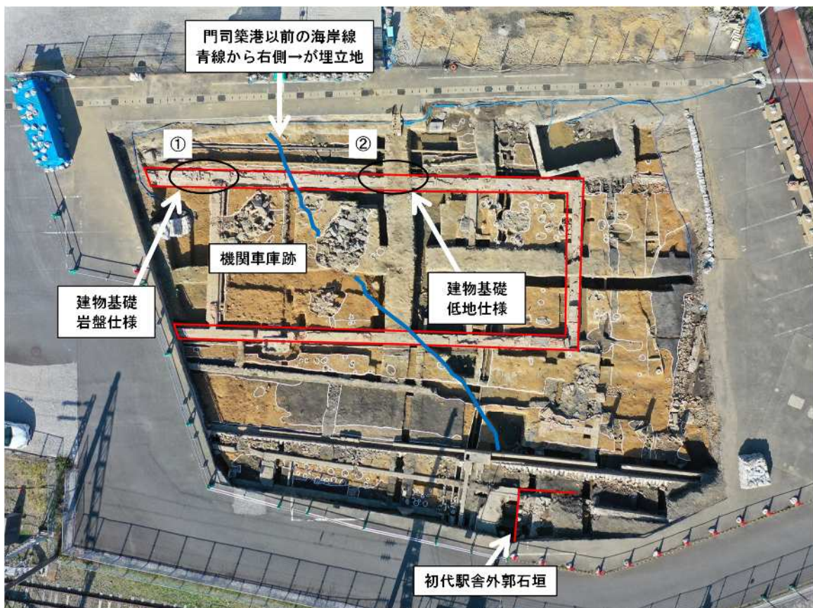
(図) 発掘調査における旧門司駅舎関連遺構の出土状況