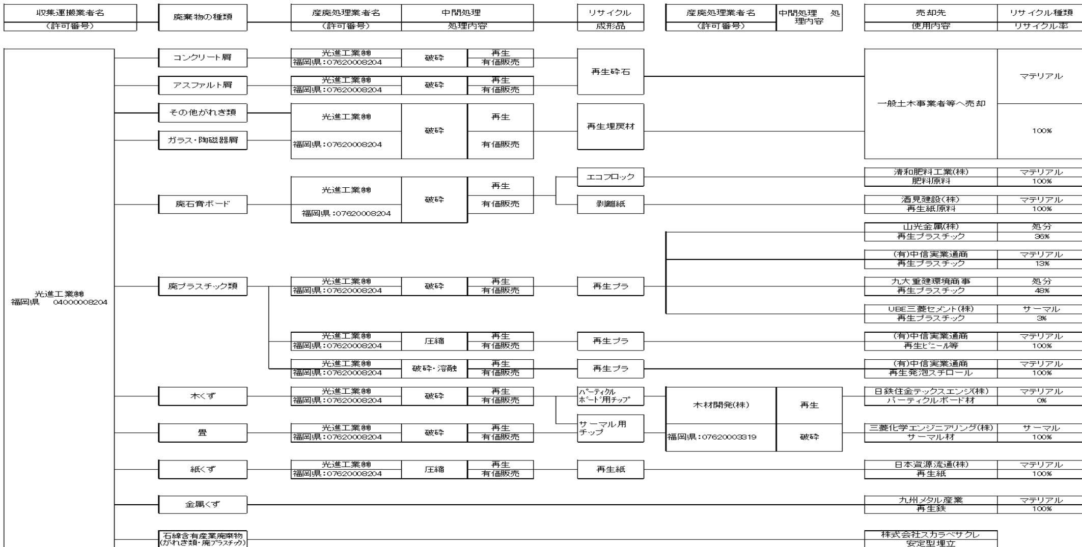
産業廃棄物処理フロー図