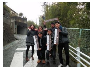
学生と一緒に看板づくり