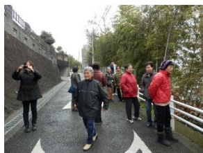
まち歩き調査の様子