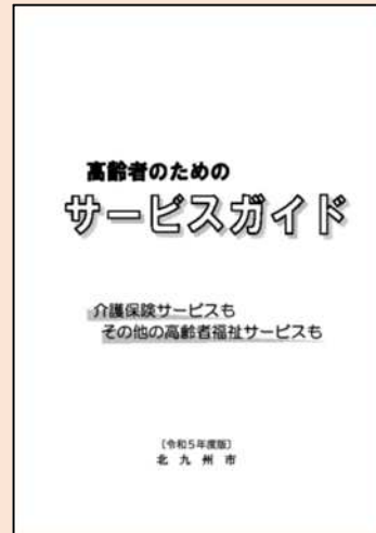
高齢者のための サービスガイド