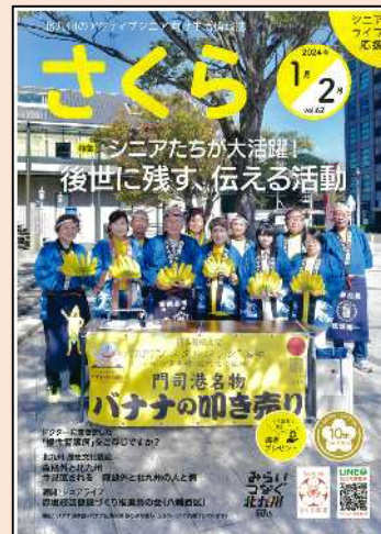
さくら (アクティブシニア向け生活情報誌)