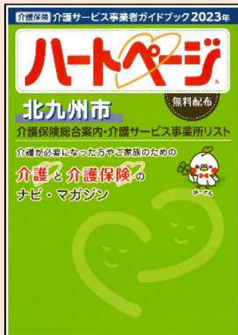
ハートページ (介護事業者がトクブック)