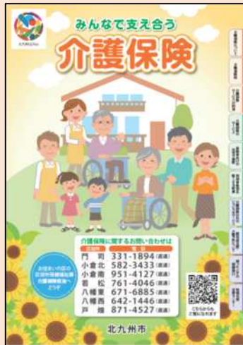
みんなであえ合う 介護保険