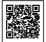
違反対象物公表制度