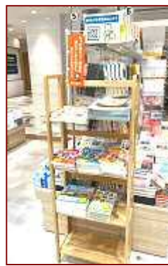
くまざわ書店小倉店様