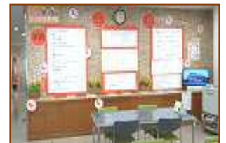
一枝市民センター