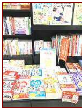
未来屋書店八幡東店様