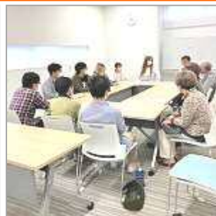
講座と交流会の様子