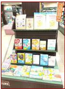
ブックセンターウエスト 小倉本店様