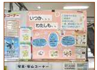
朽網市民センター