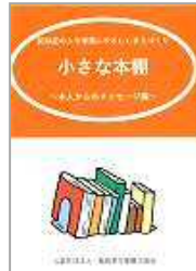
福岡県作業療法協会作成の「小さな本棚」