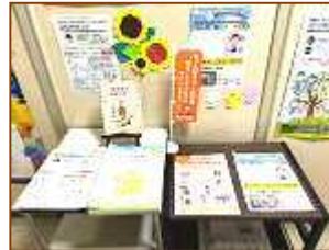
八幡大谷市民センター