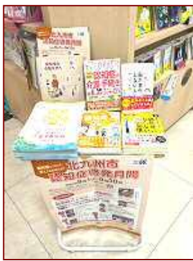
喜久屋書店小倉南店様