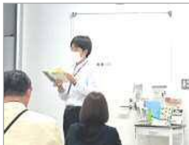
小倉南図書館 館長による朗読

小倉南図書館では、10月8日(日)に「認知症にやさしい図書館」が開催されました。