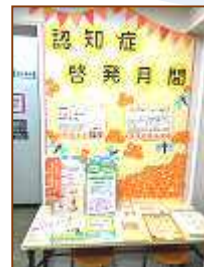
小倉中央市民センター