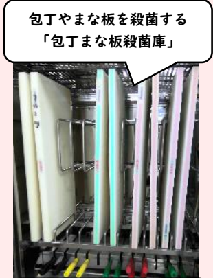
包丁やまな板を殺菌する「包丁まな板殺菌庫」

食材によって容器や器具を使い分け、食材についている菌や汚れが広がるのを最小限に抑えます。