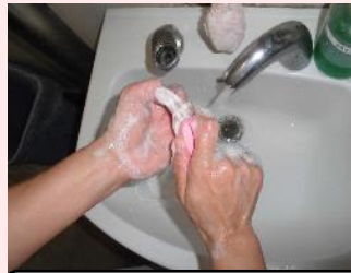
手洗い・消毒の徹底

1日2回、給食を調理する前と後に、使用する水道水の水質(残留塩素、味、匂い)を検査します。