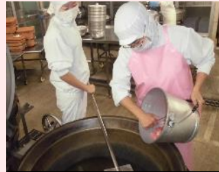
容器・器具の使い分け

調理員は、作業にとりかかる前、食品を触った後、作業の変わり目等、適切なタイミングで手洗いと消毒をします。