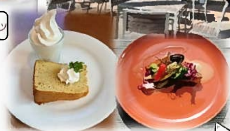
デザート:シフォンケーキ