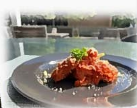
主菜:豚フィレのカツレツ