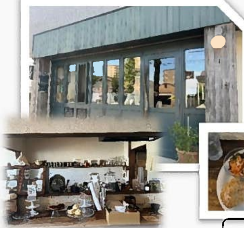
『お店の自慢・こだわり』

人気メニューは季節の果物を使用したスイーツ。 お客さんが過ごしやすい空間(お家でゆっくりしながら美味しいお茶と甘いお菓子を食べるような雰囲気)になることを意識している。季節の果物を使用したフランスの家庭菓子やアイスを提供。店内中お菓子の甘い香りがしており、甘いもの好きな方には幸せな空間♪ 「ケーキセット(写真中)」はケーキ2種・アイス1種・ドリンクを選ぶことができる。どれも季節のお菓子を