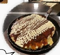
お好み焼き 770円から