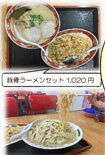
豚骨ラーメンセット 1,020円