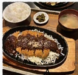
週替わり定食 (平日のみ) 800円