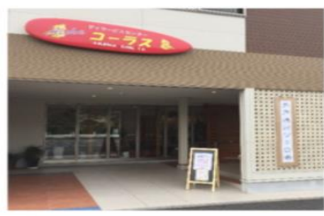
会場は2階（エレベーターあり）