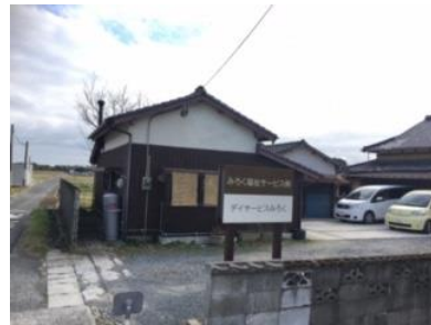
デイサービスの看板が目印