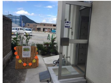
大里南公民館の奥(別館)が会場です