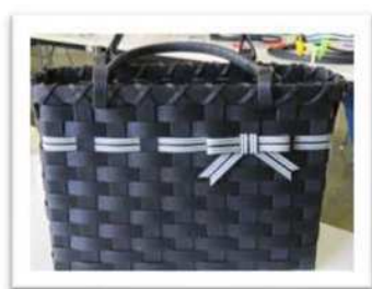
ストライプのリボンがアクセントになり とっても可愛く仕上がりました。

1本の長いクラフトテープのカットから教わり、苦戦しながらも～ 夏にぴったりのMyバックが完成し、皆さん喜ばれていました。