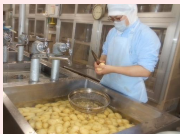
野菜は流水で3回洗い、汚れや異物を取り除きます。