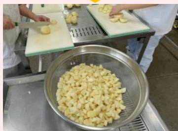
献立に合わせて食材を切りそろえます。