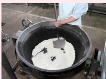
小麦粉をから炒りし、ルーを作ります。