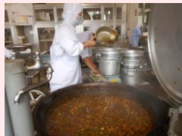
学年にあった量を計量、食缶に注ぎ分けます。