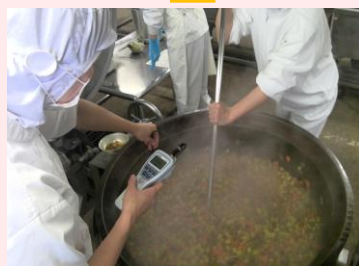
十分に加熱されているか確認します。