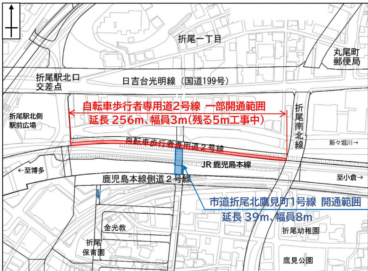
自転車歩行者専用道2号線