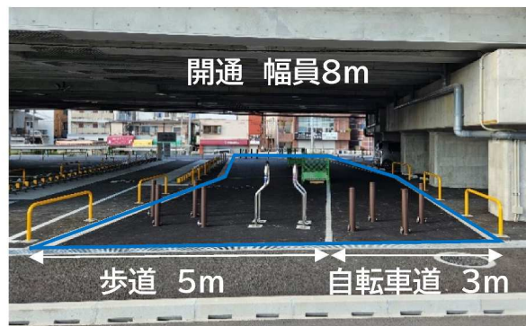
▲路線南側から撮影 (JR 鹿兒島本線高架下)