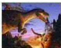
いのちのたび博物館