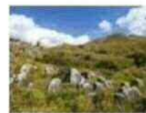
平尾台 カルスト台地