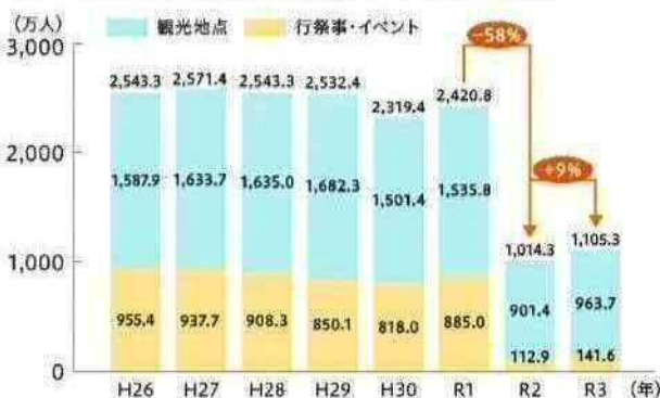
図 北九州市の観光客数(延べ人数)の推移