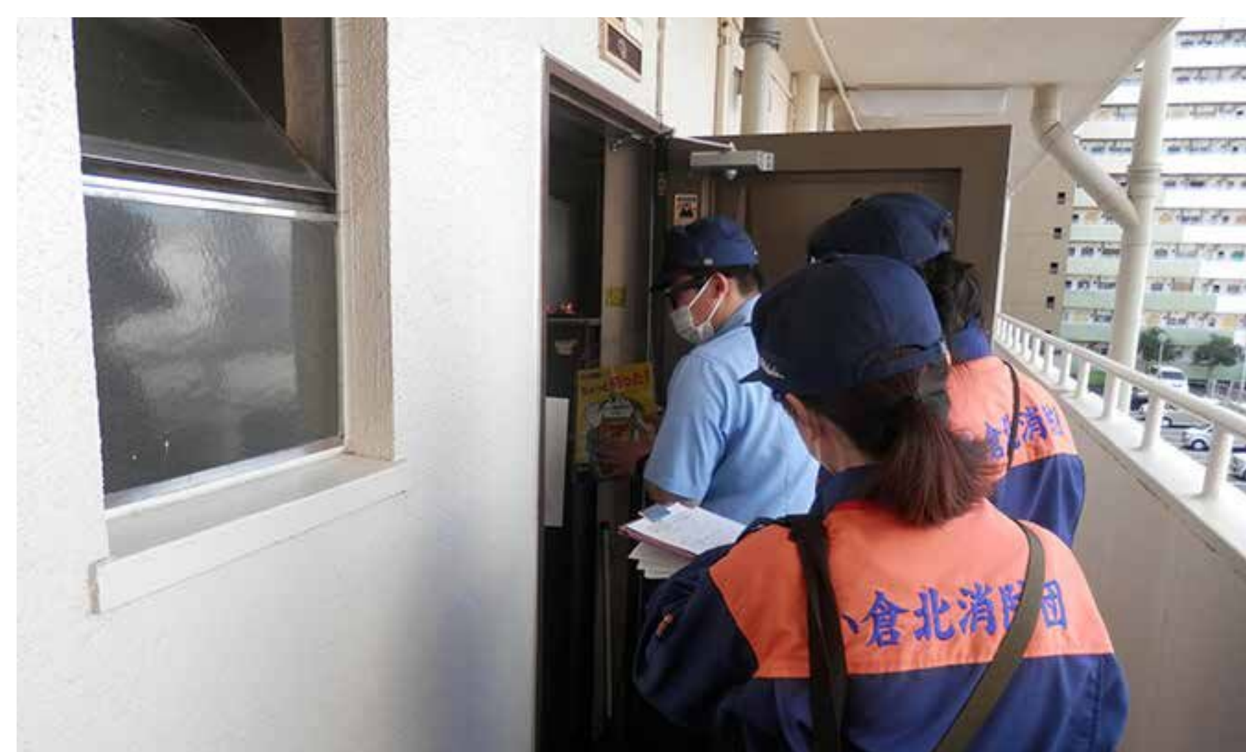
消防団員と警察官による戸別訪問