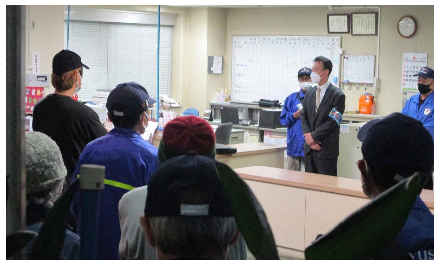
防犯パトロール隊との夜間パトロール出発式