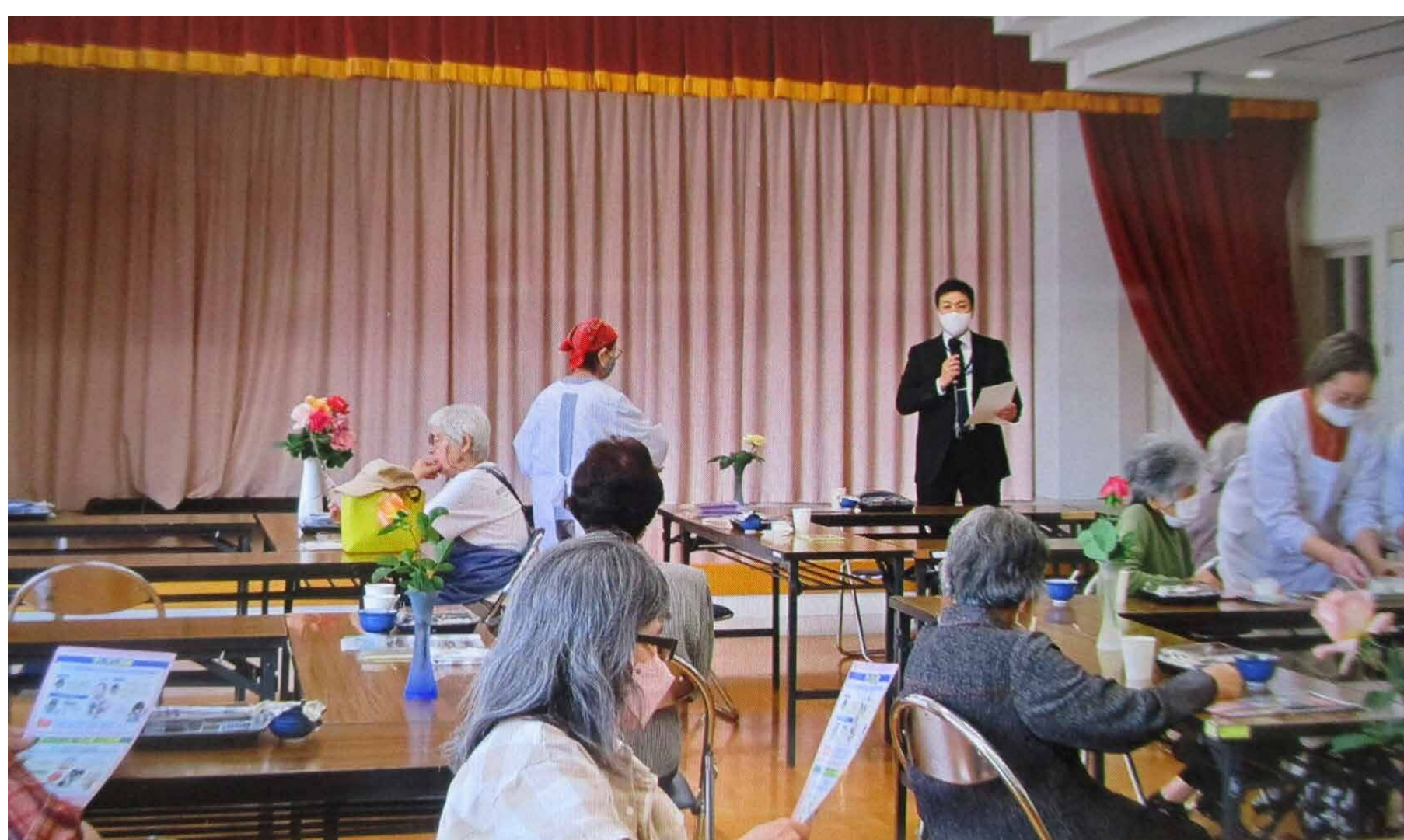
市民センターふれあい昼食交流会における防犯講話