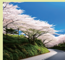
AIアート：北九州風景街道