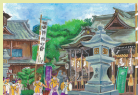
スケッチ：小倉北区 八坂神社