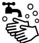
石けんによる手洗い