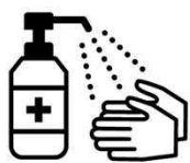
手指消毒用アルコールによる消毒の励行