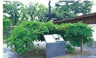
古い大株から育って茂った藤も見事です。