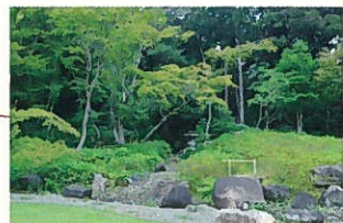
庭園の一角には滝も。一定の時間ごとに水が流れ、涼やかな水の音も楽しめます。