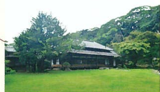
座敷内のカフェから眺める広々とした庭園の緑は圧巻。カフェは憩いの場にも。