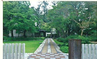
第二次本邸跡をモチーフに整備された外構も見どころの一つ。