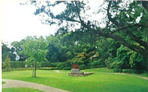
安川敬一郎が官営八幡製鐵所誘致に貢献したという史実にちなんで市が整備した、鐵の記憶広場。