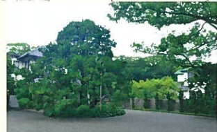
本館棟のエンタランス。見事なカイズカイキギが訪れた人を迎えてくれます。