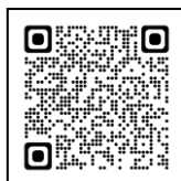
北九州市ホームページ QRコード

( https://www.city.kitakyushu.lg.jp/ken-to/07400213.html ) をご覧ください。