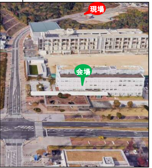
引用元: Google社 [Googleマップ、Google Earth]

★駐車スペースには限りがありますので、なるべく乗り合ってお越しいただきますようお願いいたします。