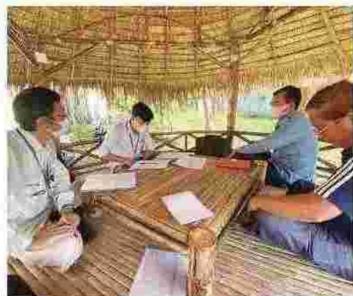
地方民営水道への行政立入検査

カンボジア全土で、安全安価で豊富な水の供給を目指して、国の担当省庁と共に組織の体制作りや能力開発に取り組んでいます。