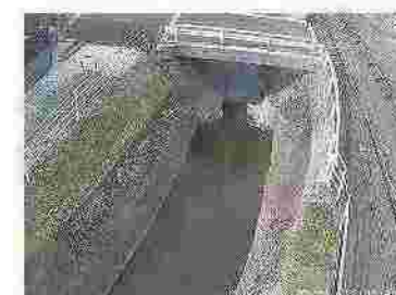
河川のライブカメラ映像