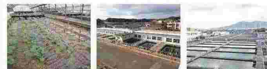
井手浦浄水場(わさび園)

水は私たちの毎日の生活に欠かせない大切な資源です。浄水場では、「水の大切さ」や「安全で安心な水づくり」を楽しく学べます。