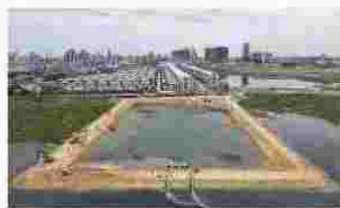
カンボジア下水処理場の建設状況

また、現在日本政府により首都プノンペンで初となる公共下水処理場が造られており、北九州市もこのプロジェクトに参画しています。