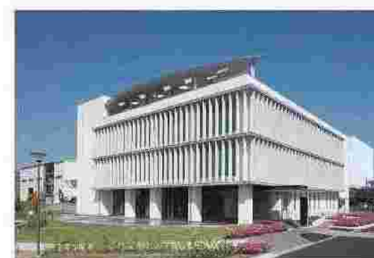
ビジターセンター外観

プロジェクションマッピングや、1時間に73ミリの豪雨を体験できる降雨体験装置などを備え、下水道について楽しく学べる体験型施設です。令和3年10月に見学者2万人を達成しました。