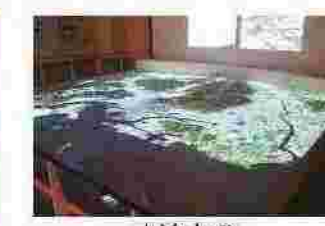
大迫力のプロジェクションマッピング

【日明浄化センター見学受付】ご利用の際には予約が必要です。 日明浄化センター 小倉北区西港町96番地の3 TEL 093-581-5670 FAX 093-581-5680