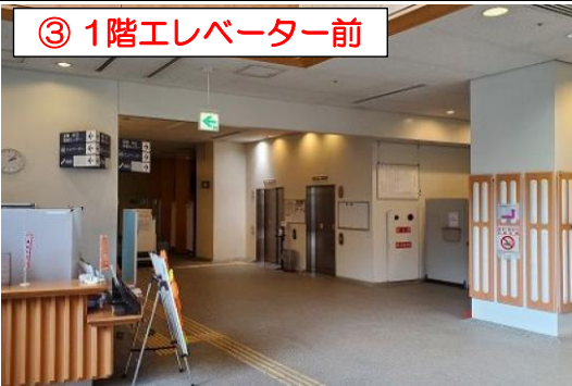
③ 1階エレベーター前