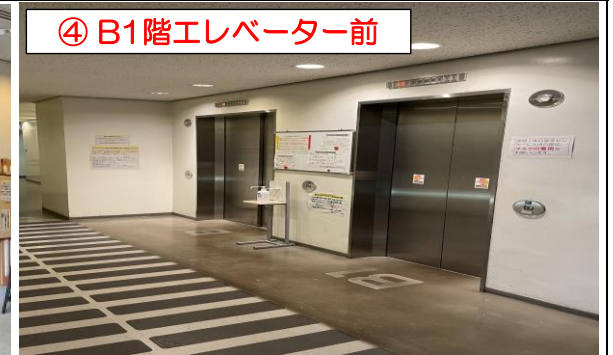
④ B1階エレベーター前