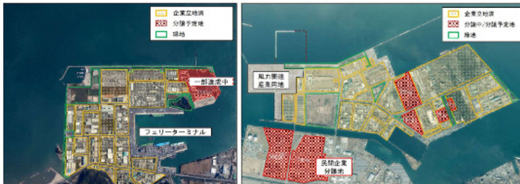
図 4-13 北九州港の土地の分譲状況（左：新門司北地区 右：響灘東地区）

両地区ともに、産業の集積が進む一方で、新たな企業進出に対応出来る産業用地が不足しているため、 新たな用地需要への対応が求められています。