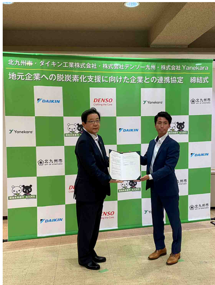
令和4年10月5日 連携協定式の様子