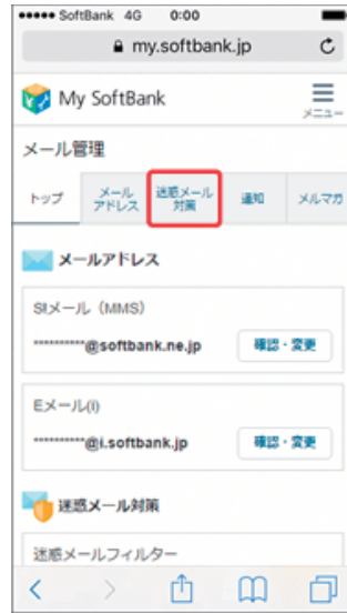
(2) 「迷惑メール対策」を押します。