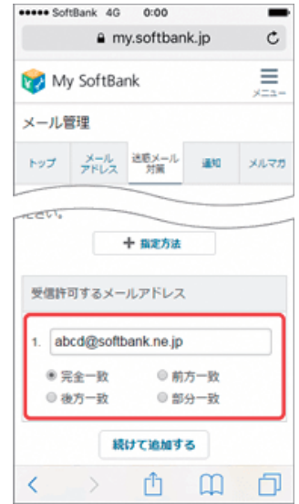
(4) メールアドレスの一部、または全部を入力し、指定方法を選択します。