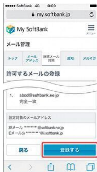
(6) 「登録する」を押します。