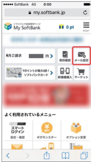
(1) My SoftBankへアクセスし、「メール設定」を押します。

※S!メール (MMS) と Eメール (i) での受信許可リスト設定が可能です