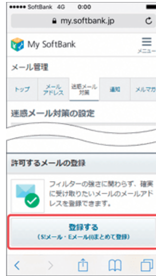
(3) 「許可するメールの登録」の「登録する」を押します。