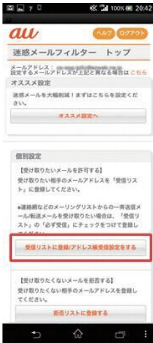
(1) [受信リストに登録／アドレス帳受信設定をする]を選択