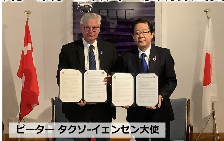
ピーター・タクソ・イェンセン大使