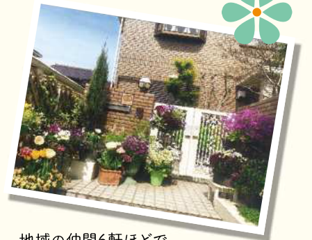
地域の仲間6軒ほどでオープンガーデンの日を設け、広く庭を開放したこともありました。

その花講座の講師はフラワーコーディネーターの1期生の方。季節ごとにタネを蒔いて、苗を作り、土作り、肥料のあげ方、花壇の作り方など色々なことを学びました。通っているうちに仲間も増え、作った苗を交換したりアドバイスしあったり。お陰で我が家の庭も市のコンクールで認められるようになり、2018年には「花の匠」までいただきました。勧められて受講したフラワーコーディネーターの講座では、学校や施設など公共花壇を指導するためのスキルを学び、活動の幅も視野も広がったように思います。