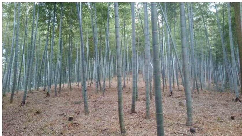
整備された竹林(小倉南区)