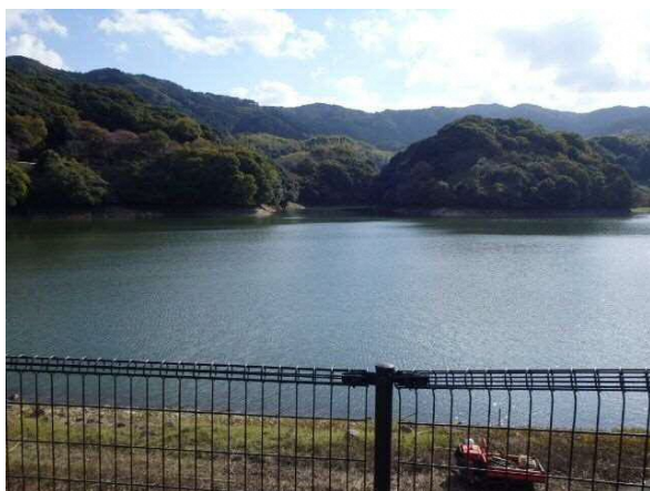
ため池（小倉南区：昭和田池）