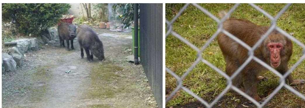
人家の近くに現れたイノシシ・サル