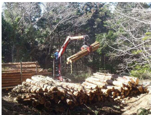
木材の集積(八幡西区)