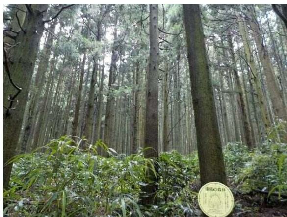
整備された森林(小倉南区)