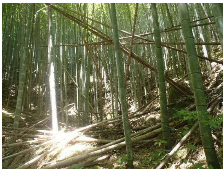
放置竹林(小倉南区)