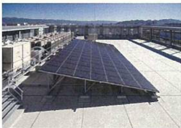
①自家消費型太陽光発電設備