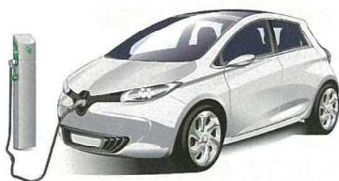
③電気自動車の購入とV2H充放電設備の設置(セット導入に限定)