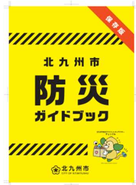
防災ガイドブック（A4サイズ）