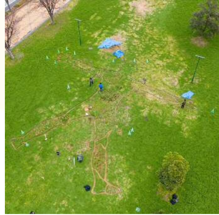
団塚 栄喜 (地域のハーブで制作中の「ハーブマン」)