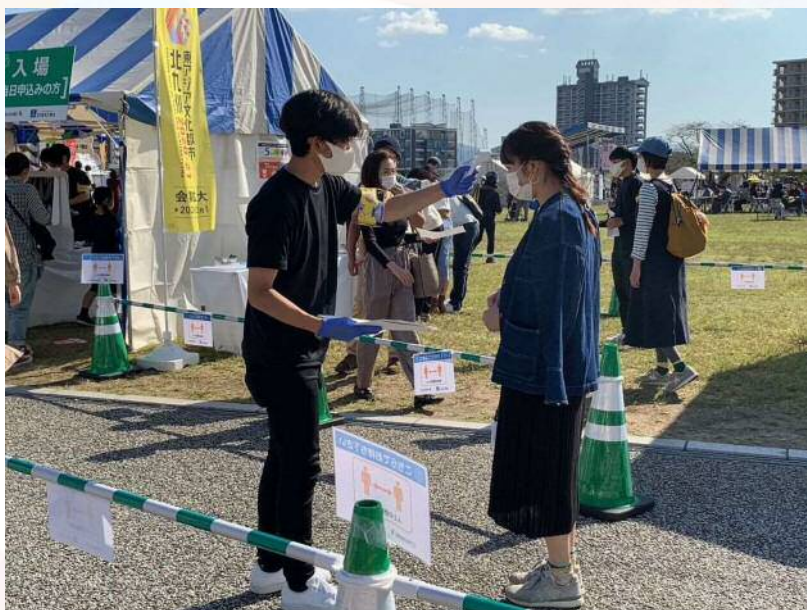
屋外でのコロナ対策の様子