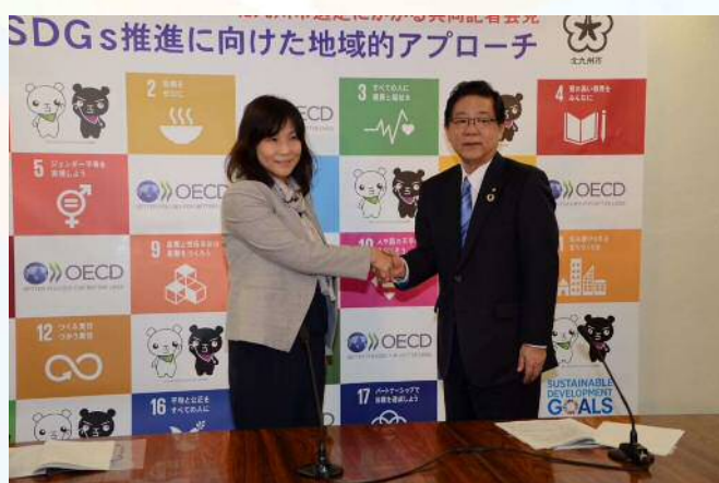
「SDGs推進に向けた世界的モデル都市」に選定 (2018年4月18日)