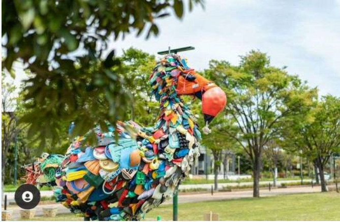
淀川テクニック (漂着物で制作中の「ドードー」)