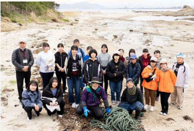
淀川テクニック (市民ボランティアと小倉北区・藍島で 作品材料となる漂着物を収集)