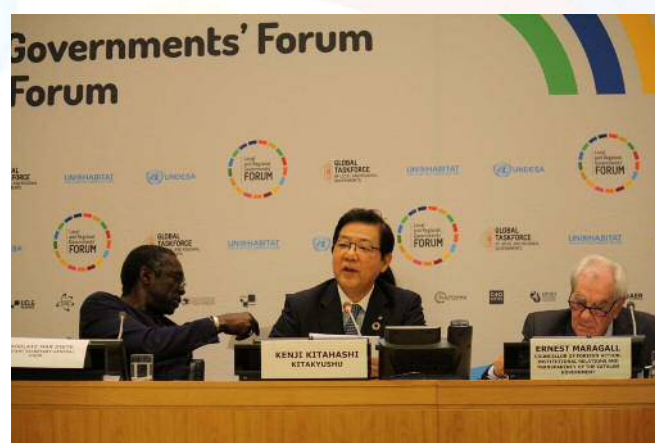
「国連ハイレベル政治フォーラム」に出席 (2018年7月16-17日)