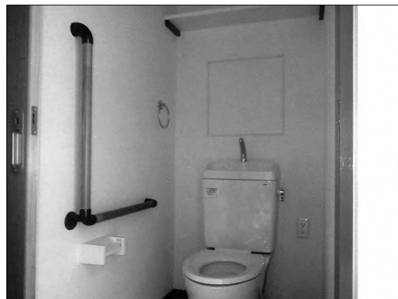
(市営住宅におけるバリアフリー化の推進(手すり設置等))