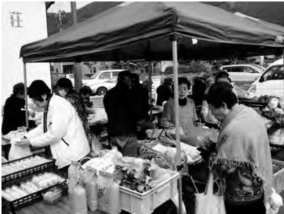
(わいわい市場 葛原)