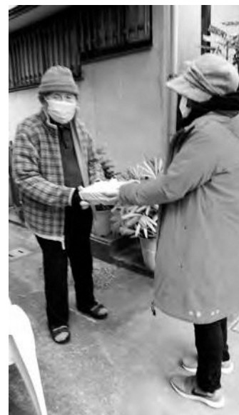
(訪問給食サービス(高齢社会をよくする北九州女性の会))