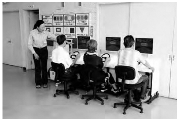
(高齢運転者シュミレータ体験教室)