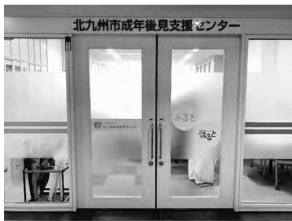
(成年後見中核機関の設置)