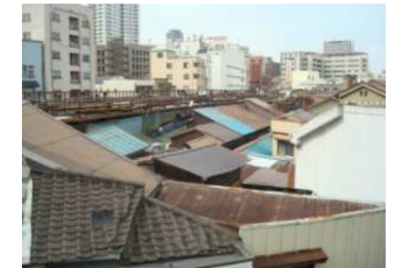
木造建築物の密集化