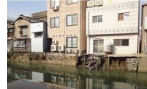
市場対岸側の護岸崩落 (H26年3月)